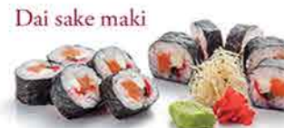
Dai sake maki