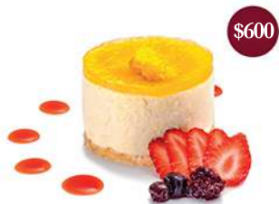
Delicia de mango y maracuyá