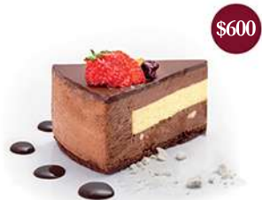
Mousse de chocolate con corazón de azafrán