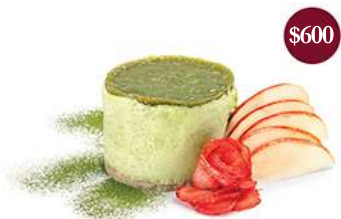
Mousse de matcha