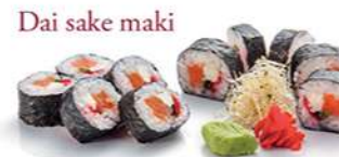
Dai sake maki